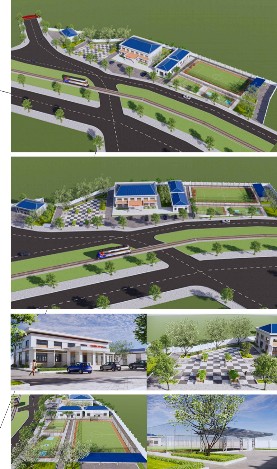
PHỐI CẢNH TỔNG THỂ DỰ ÁN:

CHỈ TIÊU KIẾN TRÚC * KHU TRUNG TÂM VĂN HÓA - THỂ THAO: - HỘI TRƯỞNG TRUNG TÂM VĂN HÓA - THỂ THAO (TỐI THIỂU 200 CHỖ NGỒI). - PHÒNG CHỨC NĂNG (HÀNH CHÍNH; ĐỌC SÁCH, BÁO; HOẠT ĐỘNG VĂN HÓA, VĂN NGHỆ, THỂ DỤC, THỂ THAO PHÙ HỢP) - CÔNG TRÌNH PHỤ TRỢ TRUNG TÂM VĂN HÓA - THỂ THAO (NHÀ ĐỂ XE, KHU VỆ SINH, VƯỜN HOA...) * SÂN TỎ CHỨC CÁC HOẠT ĐỘNG THỂ DỤC, THỂ THAO: