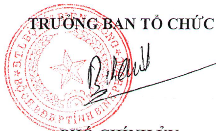
PHÓ CHÍNH ỦY Đại tá Hoàng Văn Thành

+ Tặng Giấy khen của Bộ Tư lệnh BDBP và tiền thưởng kèm theo như sau: 05 giải Ba, mỗi giải trị giá 10.000.000đ (mười triệu đồng); 10 giải Khuyến khích, mỗi giải trị giá 5.000.000đ (năm triệu đồng).